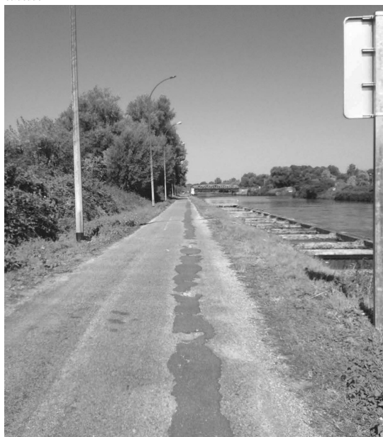
chemin de halage rive gauche