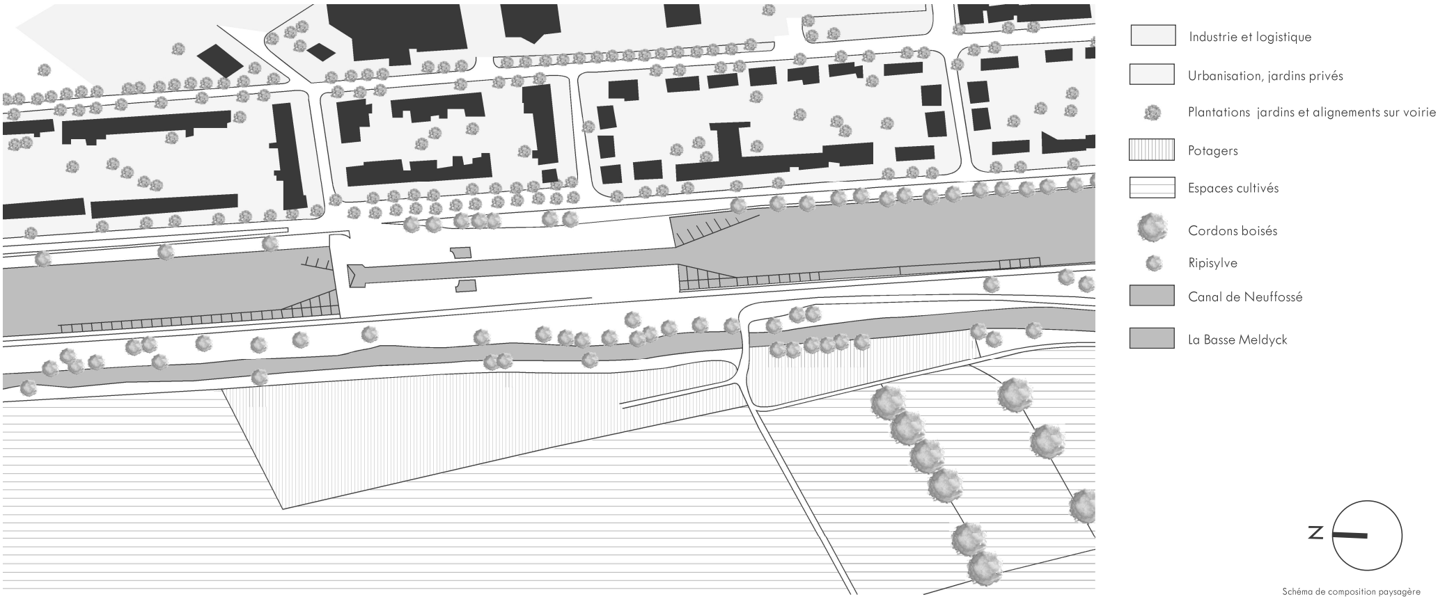
Schéma de composition paysagère

Ce paysage rural de bocage fait face aux alignements d'arbres de la zone urbanisée.