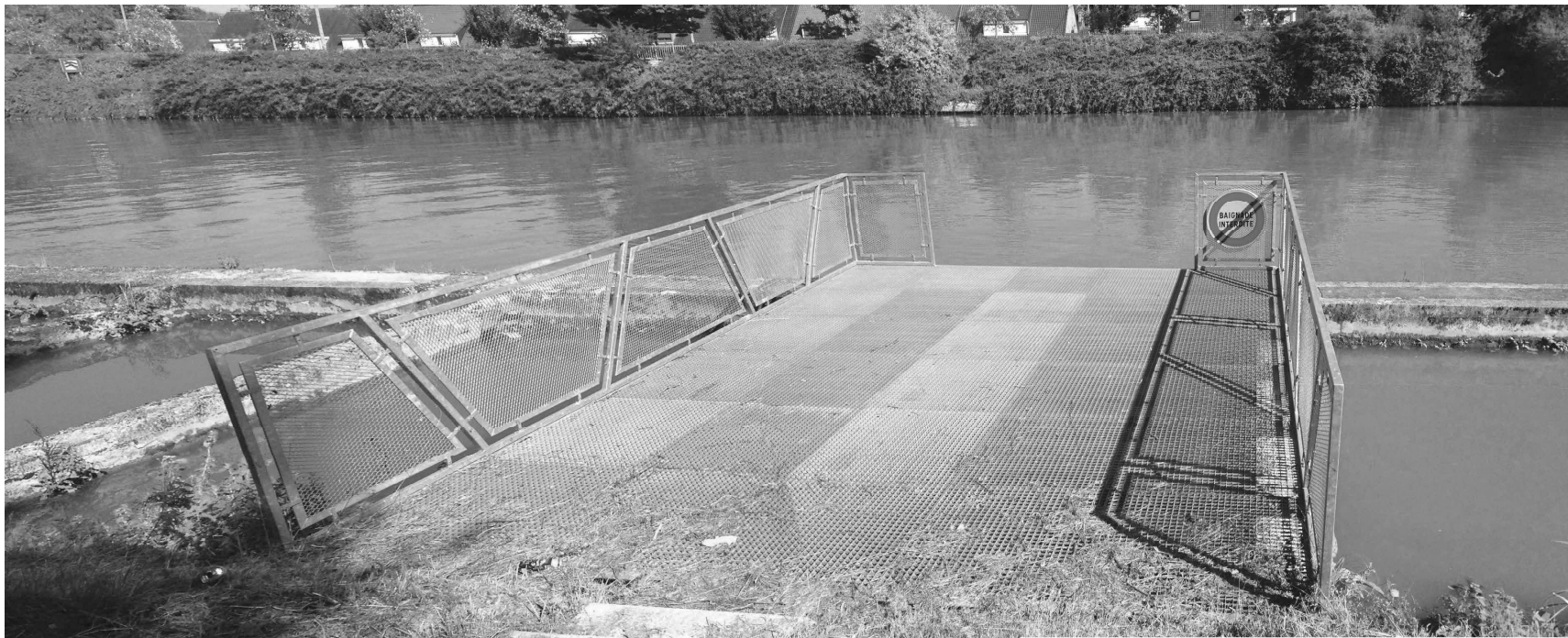
Photographies des équipements présents sur les estacades