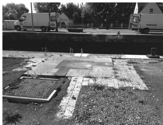
Photographies des bajoyers