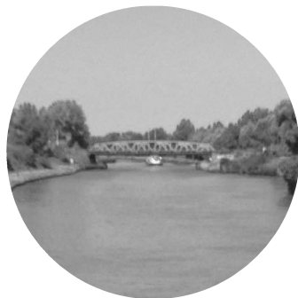
pont ferroviaire (aval)

En aval, elle est suivie d'un ouvrage ferroviaire métallique type poutres latérales entièrement peintes en bleu et appartenant à la SNCF. Sa structure maintient la transparence vers le paysage lointain.