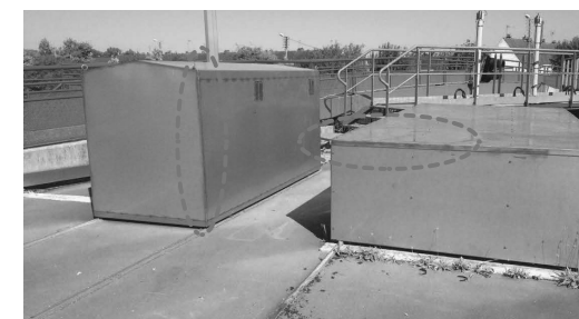
Photographies des différents équipements de l'écluse