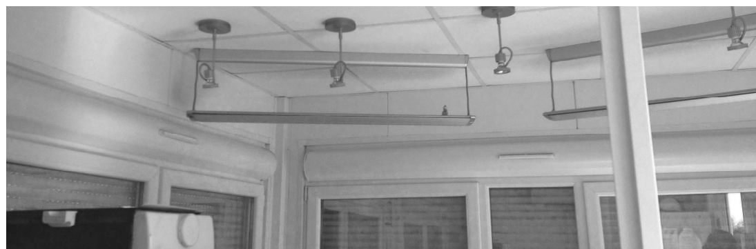
Photographies de la cabine de commandes