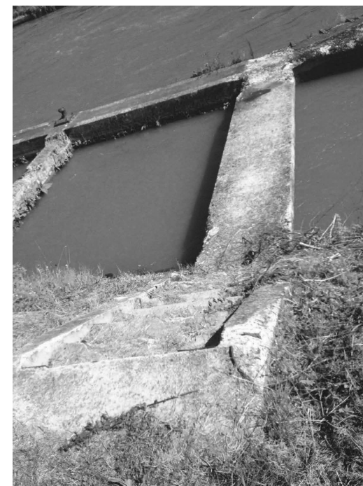
Photographies des estacades