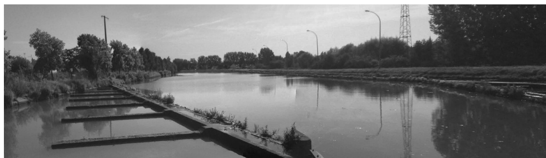
vue vers l'amont