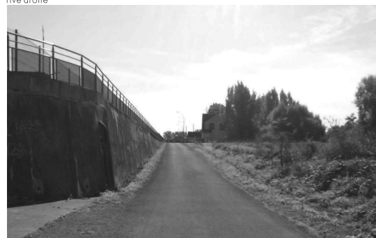
chemin de halage rive gauche