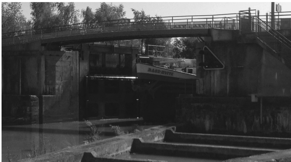
Photographies des différents équipements de la passerelle