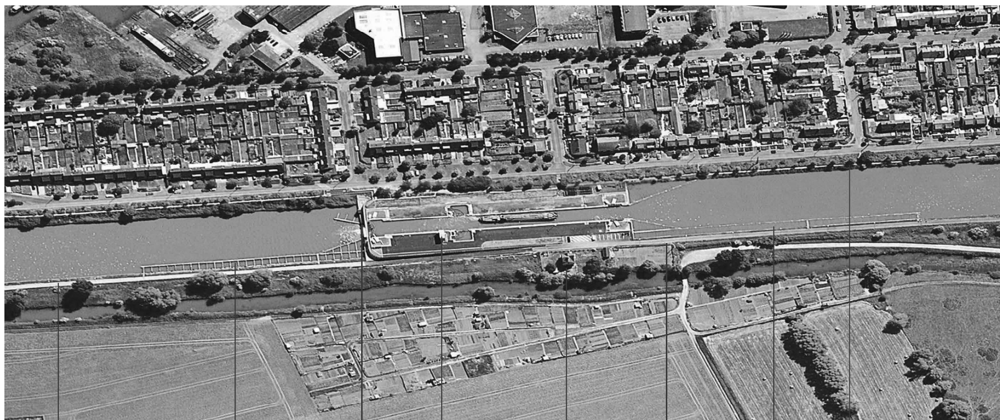
chemin de halage rive gauche