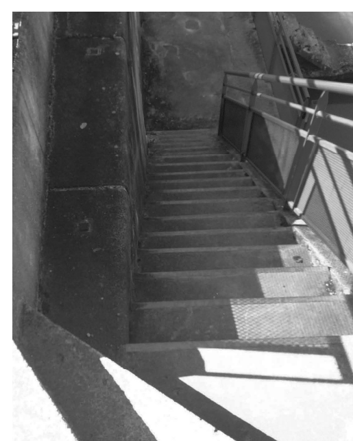
Photographies des différents équipements de la passerelle