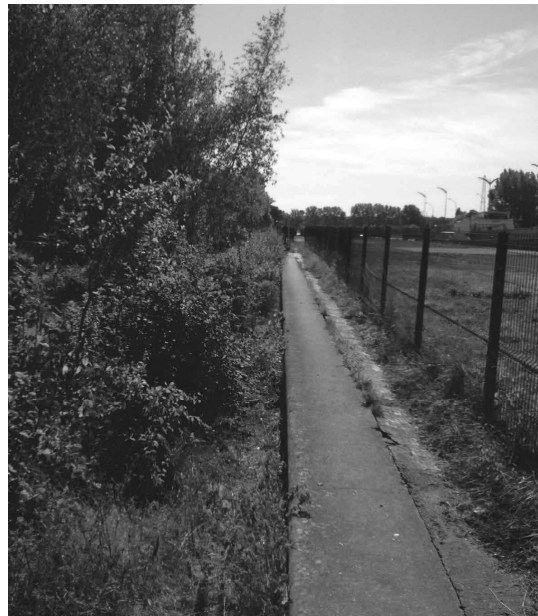
clôtures rive droite