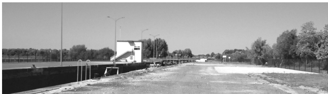
vue de l'écluse