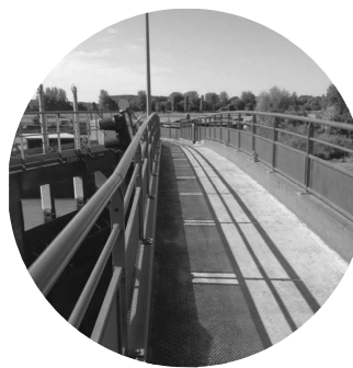
passerelle piétonne (aval)